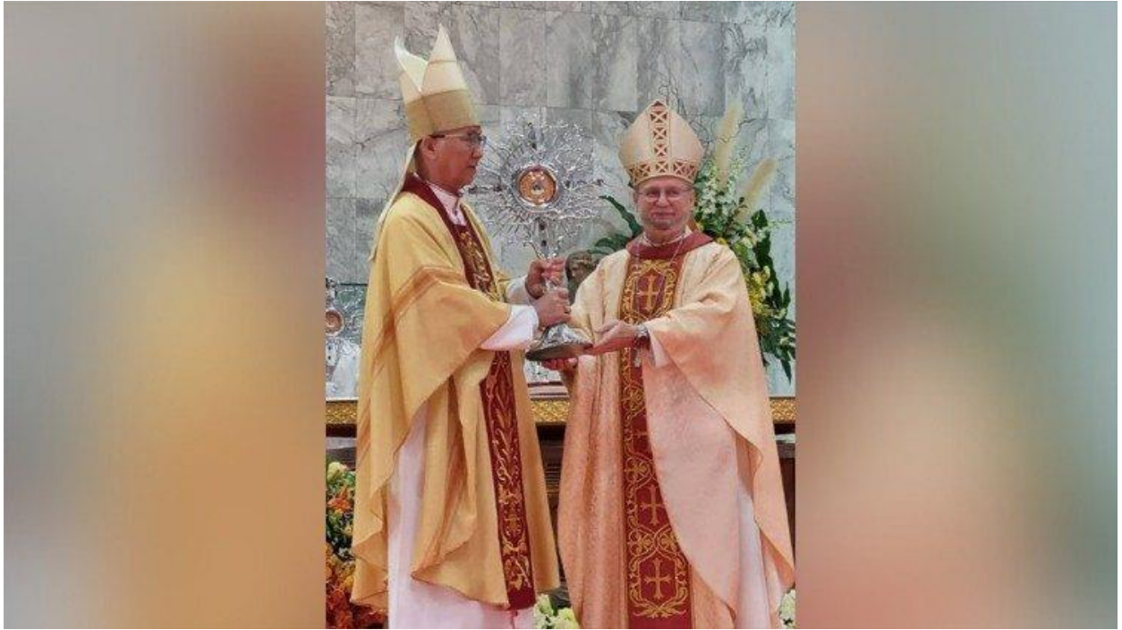
Trao Thanh tích